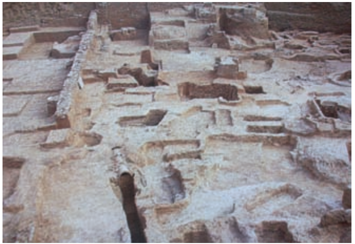
Άποψη της ανασκαφής του Νεκροταφείου του Κεραμεικού στα 1870.